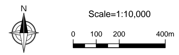
図5.2.8.21 注目すべき土壌動物の確認位置