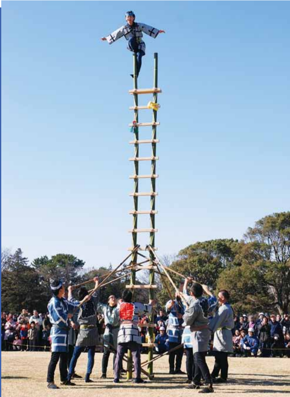
平成26年消防出初式「はしご乗り」

◆ 定例会に提出された一般会計補正予算は、新たな事業となる在宅医療推進事業に79万9000円が計上されました。これは、県の地域医療再生計画に基づき在宅医療を提供する機関の連携体制を構築するもので、今年度は在宅医療に関する人材の育成や連携の拠点づくりが行われます。