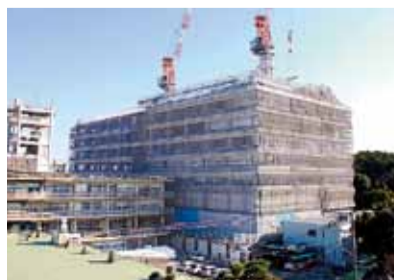
今年5月の第1期工事完成に向け建設が進む市役所新庁舎

なお、今回の補正の結果、新庁舎建設事業の事業費総額は12.5億373000円となりました。