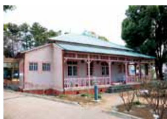
旧横浜ゴム平塚製造所記念館

勤労会館、土屋霊園、旧横浜ゴム平塚製造所記念館、湘南ひらつかパークゴルフ場、大神スポーツ広場などの市の施設の管理者を平成26年4月1日から平成31年3月31日までの期間指定する6件の議案が市長か