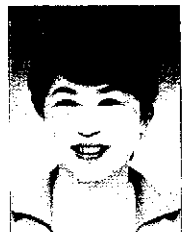
社民党 福島みずほ