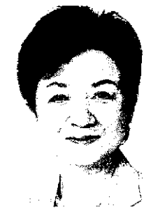
未来の党 代表 かのた由紀子

いま、日本中に、将来への不安や、政治への不信、失望がうずまいています。 この不安を安心に。失望を希望に変えなければ…。 私たちは、「このままでは選ぶ政党がない。」という声に応え、新しい政党をつくることを決意しました。 ふくしまの事故を収束させて着実に原発から卒業する道を示すこと。消費増税を凍結すること。 女性が生き生きと活躍し、子どもがすこやかに育つ社会をつくること。 それらを実現することで、だれもが希望をもてる未来をめざします。 政治は未来をつくるもの。日本の未来を決めるのは、あなたの一票です。