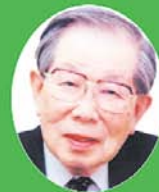
聖路加国際病院名誉院長 日野原重明

いのちは皆と支えあい、助け合って、成長するものです。 森に暮らす鳥たちの、強く生きるためのメッセージ。 このすばらしい本をお薦めします。