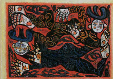
《飛神の柵(御志羅の柵)》1968年 財団法人棟方板画館蔵