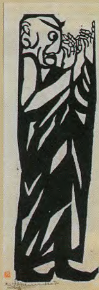
《二菩薩釈迦十大弟子 (目鍵連の柵)》1939年 財団法人棟方板画館蔵

戦後、1956年にはヴェネツィア・ビエンナーレに出品し、国際的にも評価されていきます。その後、大画面作品への挑戦、生まれ故郷の青森を題材にした作品や旅行先の風景や文化遺産に触発された作品を制作するなど、1975年に亡くなるまで創造へのエネルギーが止むことはありませんでした。棟方志功の代表的な作品を通じて、多彩な画業と表現意欲、斬新な造形をお楽しみください。