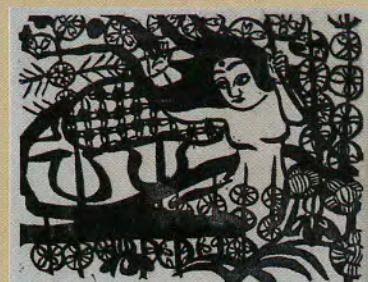
《華嚴譜(女神の柵)》1936年 棟方志功記念館蔵