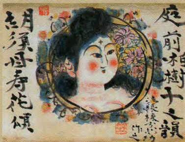
《胡須母寿花頌》1974年 財団法人棟方板画館蔵