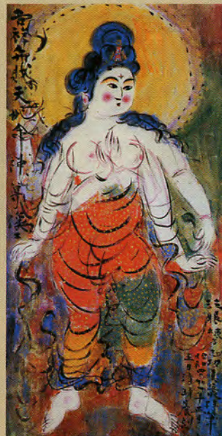
《御吉祥大辨財天御妃尊像図》1966年 青森県立美術館蔵