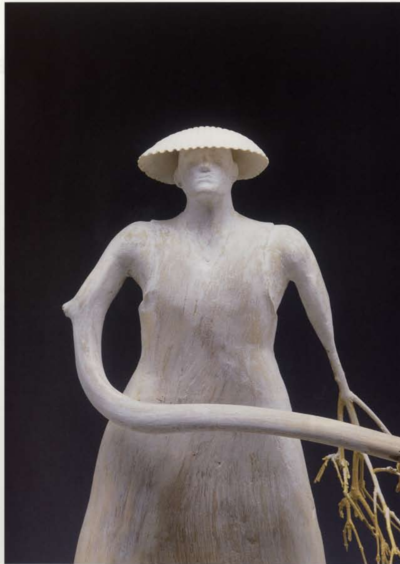
高瀬省三《午後の男》2002年