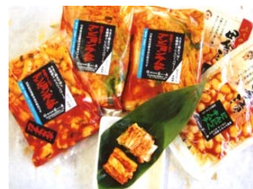
アンニョンキムチ（花巻市）