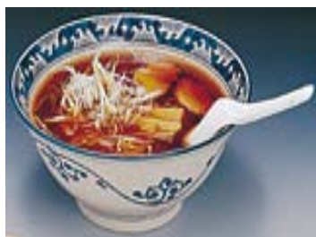
高山ラーメン（高山市）