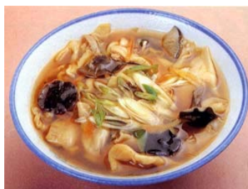
ひつつみ汁（花巻市）