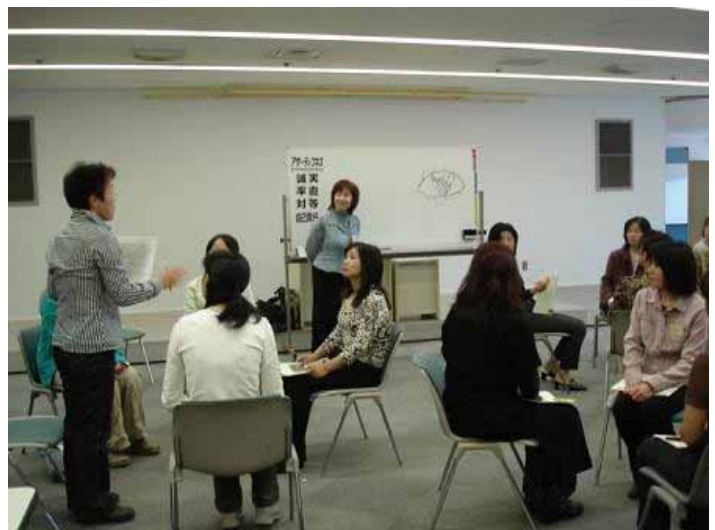
コミュニケーションも練習すれば上達します