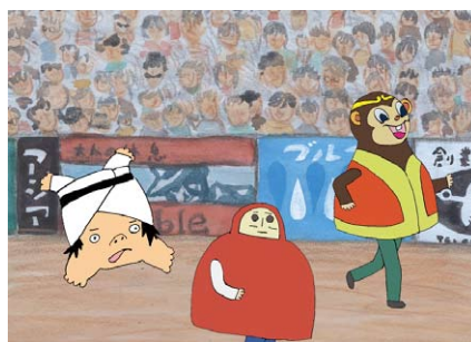
⑥《さかだちくん (ひたすらオリンピック)》 2008年