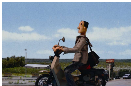
②《檸檬の路 (1)》2008 年