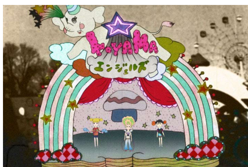
⑦《三ノ函半島百名所 (KOYAMA エンジェルズ)》2007年