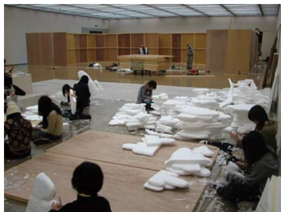
ボランティアスタッフと会場制作中

なにとぞ、おとりあげいただきたく、ご来駕たまわれれば幸いに存じます。参加ご希望の方は、別紙申込用紙にて、お申込みください。