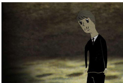
①《夢がしゃがんでいる》2008 年