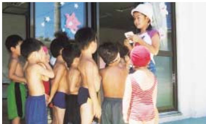
みんな元気いっぱい！

の島のハメハメ八大王。納涼会で 踊った「キン肉マン音頭」「ドレミ ちゃん音頭」も人気でした。