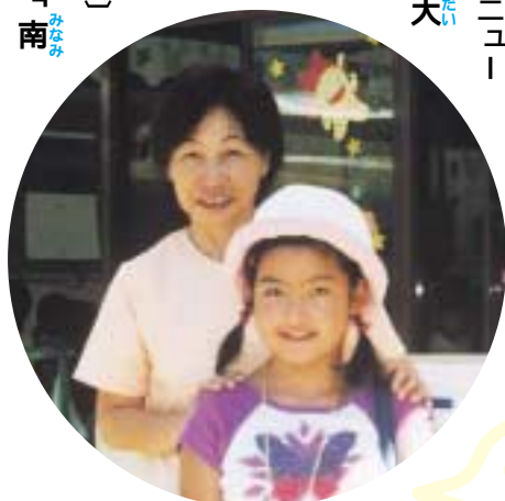
園長先生と一緒に！

わたしは、 保育園を取材 できてすく 良かったで す。また、み んなに会いに 行きたいと思 いました。