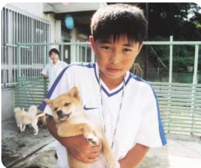
この犬かわいいなー！

「この犬かわいいなー！」 「は、年をとったから、病 気になったから、ほえて うるさいから、引っ越し 先で飼えないからなどい ろいろあるそうです。」 「ほくは、この話を聞いて とてもかわいそうだと 思いました。今まで家族 の一員のように暮らして きたのに、死ぬまでかわ