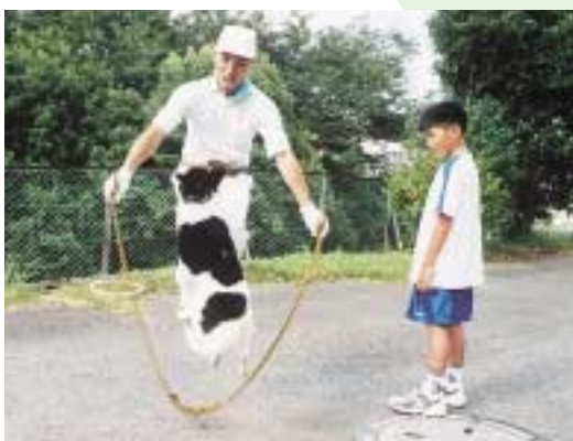
すごい！縄跳びだってできちゃうぞ

「いがつてもらえなかったからです。 でも、ここに来る動物の数は、年々 減ってきているので、少し「ほっ 」としました。 「ここでは、これらの不幸な動物た ちを減らしていくために、「犬のし つけ教室」やこれから犬や猫を飼 たいと思ってる人に、えさのやり 方や犬猫の性質・病気のことなどを 教える「わん・にゃん教室」なども 開いています。 「ペットと楽しく暮らすためには、 動物の習性を理解し、正しくしつけ ることが重要だと思いました。」