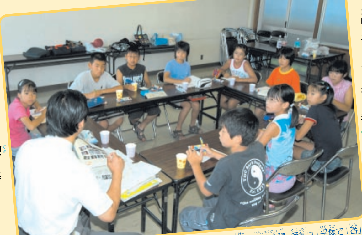
真剣な編集会議。特集は「平塚で1番」