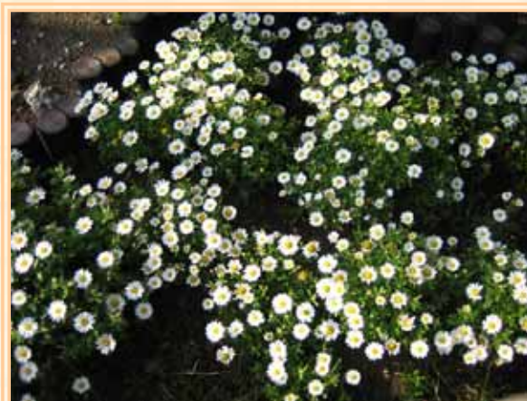
錦町公園の「ノースポール」