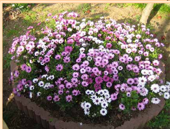
錦町公園の「オステオスペルマム」