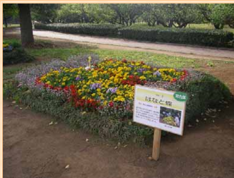
総合公園で行われた市民花壇コンクール作品 「はなと蝶」

錦町公園は、平塚駅西口から徒歩で5分程。お近くに来られた際は、お寄りになってはいかがでしょうか？