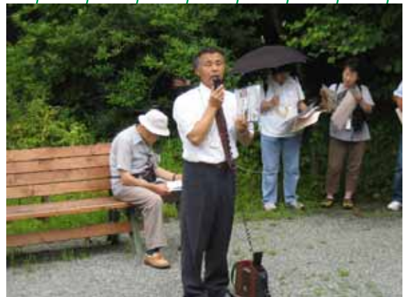
忙しい合間を縫って自ら説明に臨んでくださった園長さま。どうもありがとうございました。