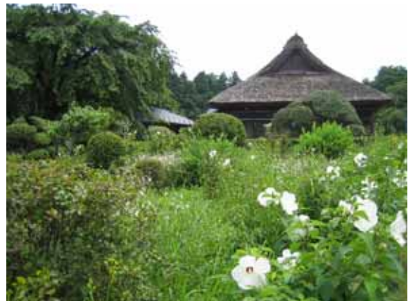
園内には数え切れないほどの植物が。特にロックガーデンの山野草等は大変な希少種が種から育てられて定植されている。

交通案内 東名御殿場 IC より車で3分または徒歩10分 JR 御殿場駅から箱根登山鉄道バス(仙石原・桃源台行)「二の岡」下車徒歩1分