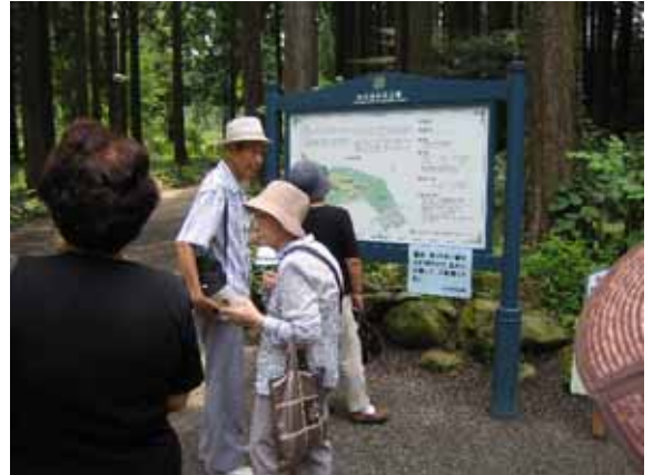
杉林の間には山アジサイ等も植栽されている。