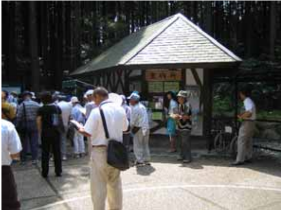
正門に入り、涼しげな「森のエントランス」を抜けると、案内所のある中門に。