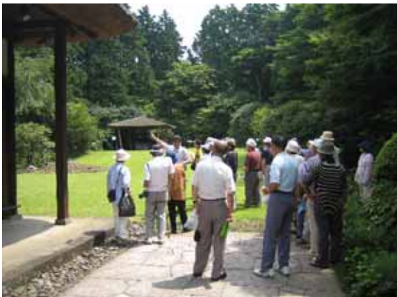
熱心に説明して下さった園長さま、副園長さま、そして担当の方々、本当にありがとうございました。