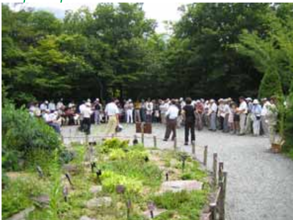
「外国の山草と園芸種」の前のコーナーで熱心に説明に耳を傾ける会員の方々。個人で訪れた場合にはなかなか聞けないお話や資料もいただきました。