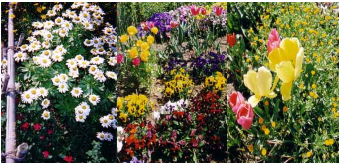
高村第2緑地 (シラギク)