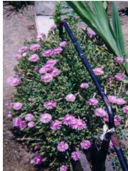
高村第6緑地 (マツバギク)