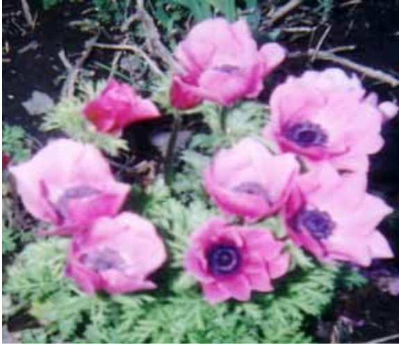
高村第6緑地 (アネモネ)