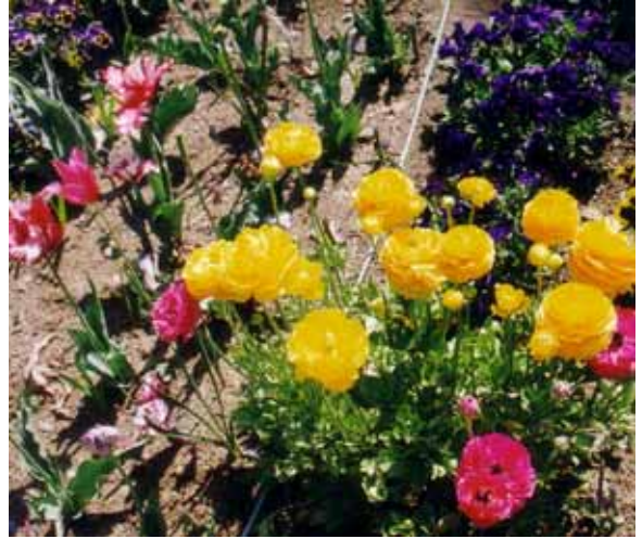
高村第5緑地 (ランンキュラス、アネモネ、ピオラ)

高村第6緑地公園愛護会は、平成10年10月20日に設立され、会員数は11人となっています。高村第6緑地公園愛護会は、高村第1・第2・第5・第6の4つの緑地をお世話してくださっています。緑地1つ1つの面積は小さいですが、その中には綺麗な花がたくさん咲いています。