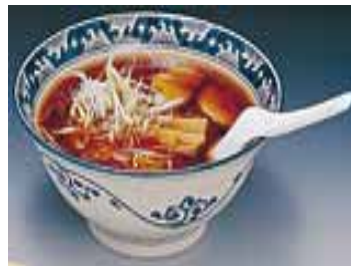
高山ラーメン（高山市）