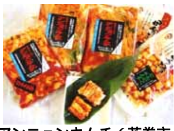
アンニョンキムチ（花巻市）