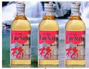
梅シロップ（伊豆市）